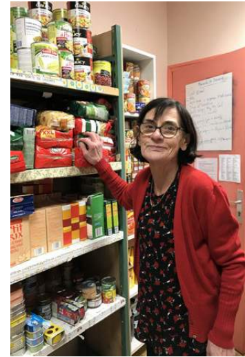
Le relais alimentaire de Bourg-la-Reine.

distribué aussitôt aux familles qui se présentent, le mercredi matin.