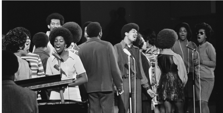
Répétition des Edwin Hawkins Singers au Grand gala du disque à Amsterdam, le 26 février 1970.